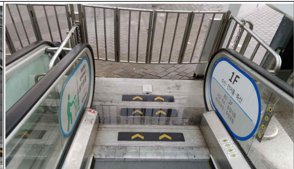
발판 빗물 유입 현장