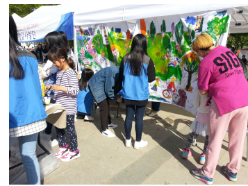
<푸른 한강공원 채색>