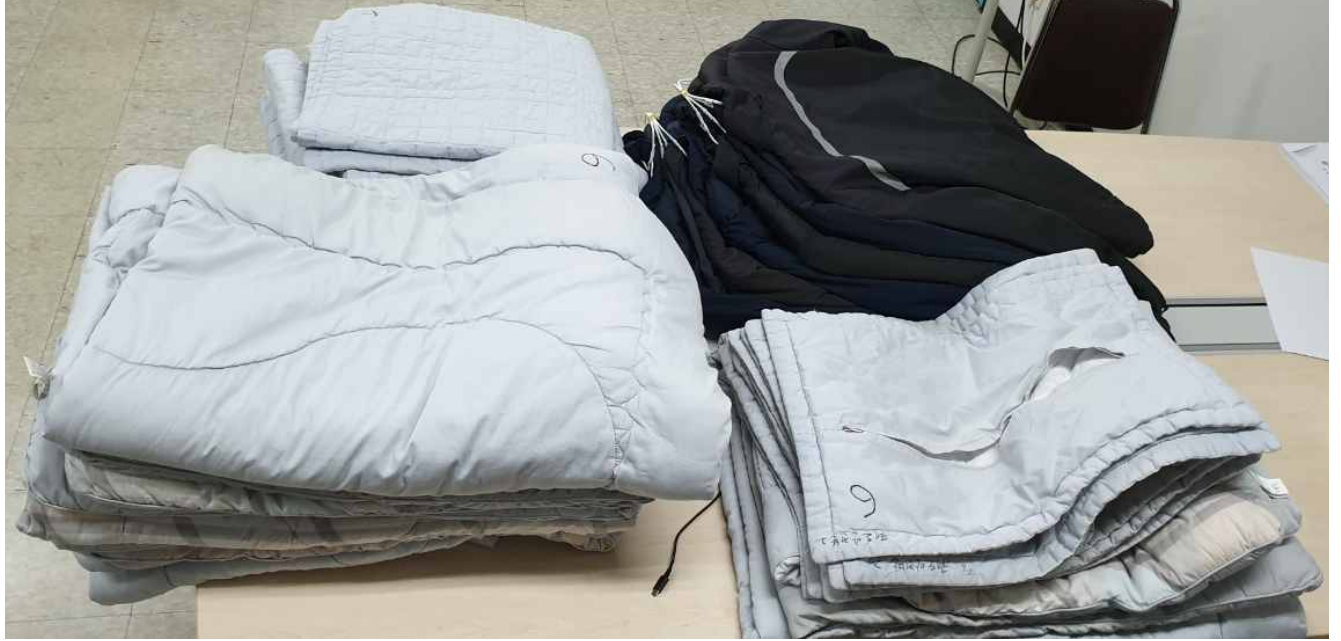
방화차량기지 세탁 결과