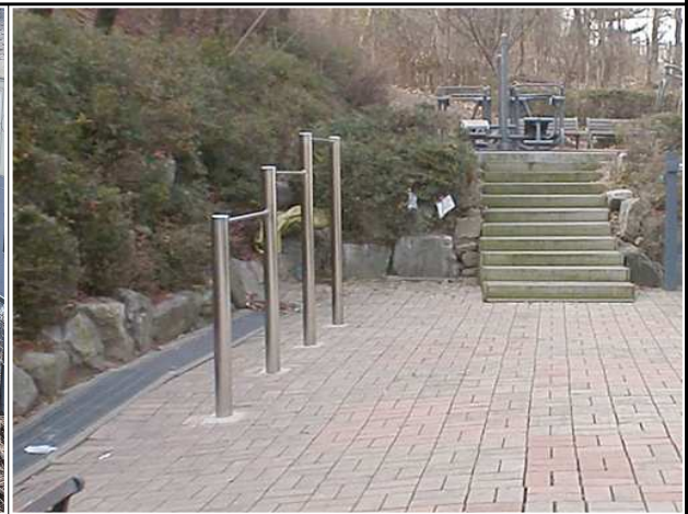
노후 바닥 및 배수로 정비(오동)