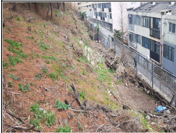
무단 경작지 녹지 복원(개운산)