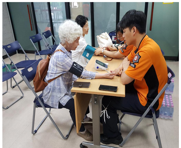
자동제세동기 교육 및 혈압체크(구급팀)