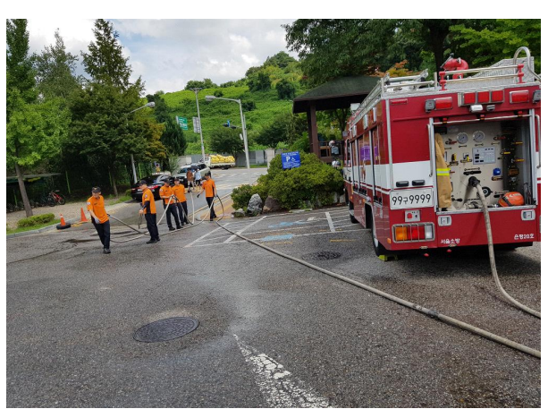
주차장 및 건물주변 방수(진압대)