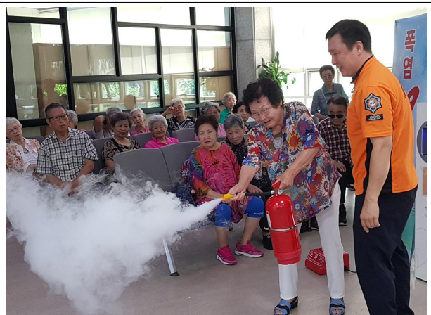
화재 및 수난인명사고 안전교육(홍보팀)