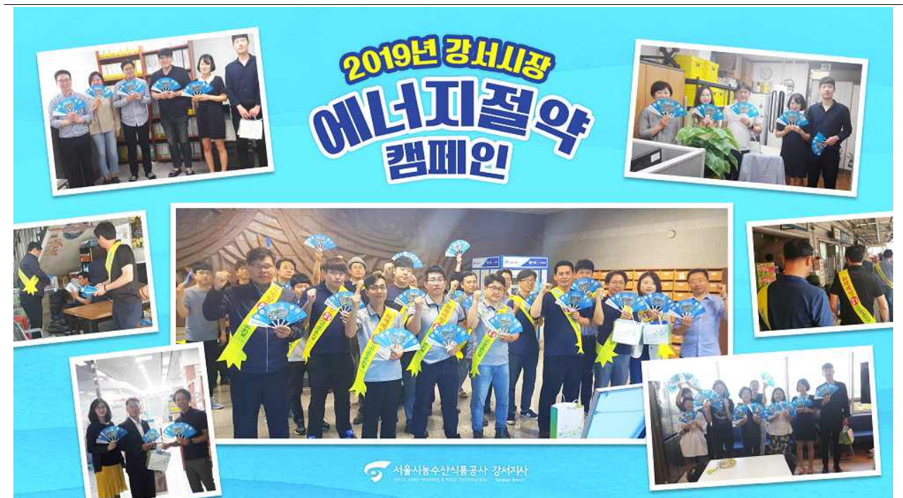
에너지 절약 부채 제작 및 캠페인