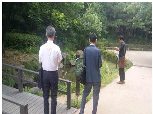
실개천 현장 확인