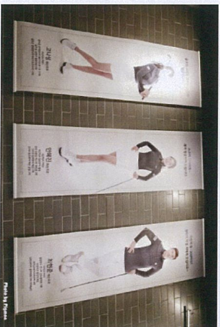
[프로 골퍼 레슨]