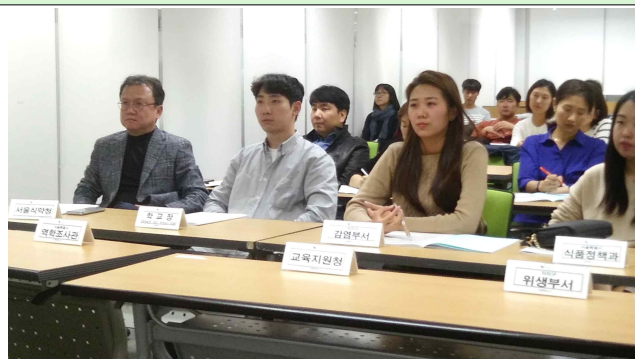
“학교급식 식중독대응협의회” 시나리오에 따른 기관별 업무분장 및 모의훈련(역학극) 실시