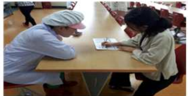
조리 종사자 설문조사