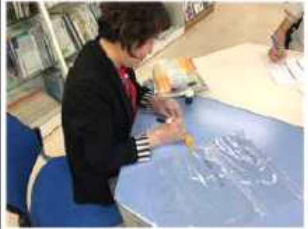
1:1 설문조사 및 가검물 채취