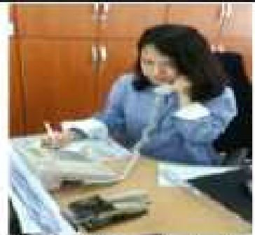
중중상재 회의(별 리포서), 학교공주지 대책회의, 의심환자 발생보고