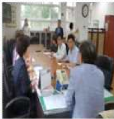
학교장 주재 대책회의