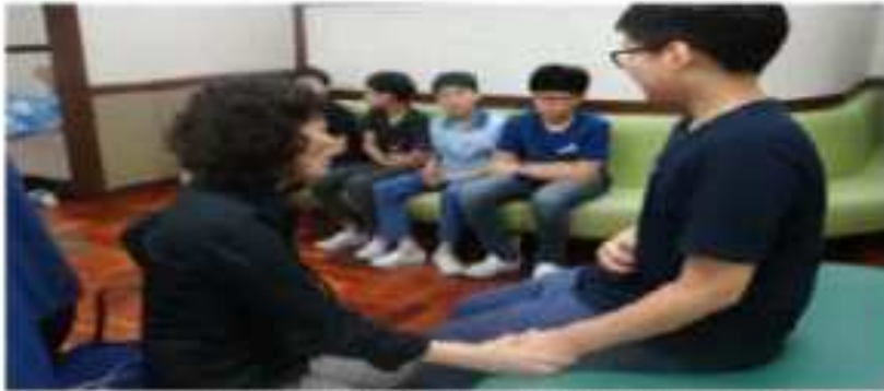
설사 등 증상으로 보건실 방문학생 증가