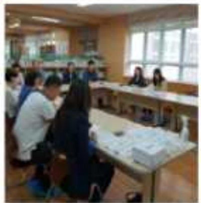
관계기관 현장도착 및 식중독대책협의체 구성