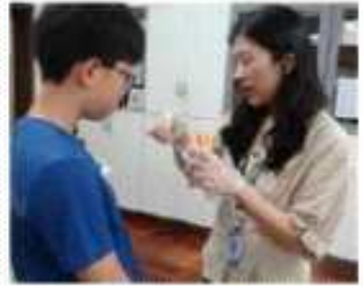
유증상자 설문조사 및 인체검체 채취