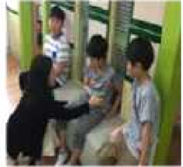
별사 등 순무으로 보편심 무문학생 용기