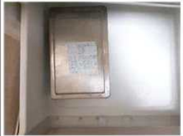
환경검체 채취(급식실, 보존식)