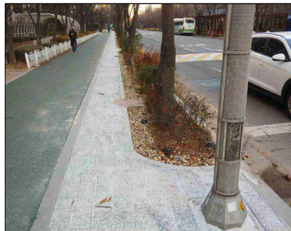
경계턱 낮추기 정비 후