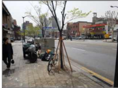
공분 메워심기 후