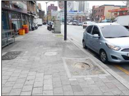
공분 메워심기 전