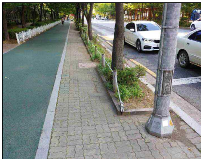
경계턱 낮추기 정비 전