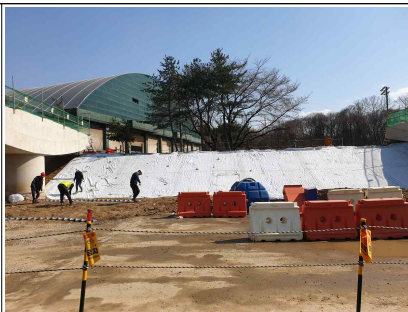
하천내 교각 설치 모습