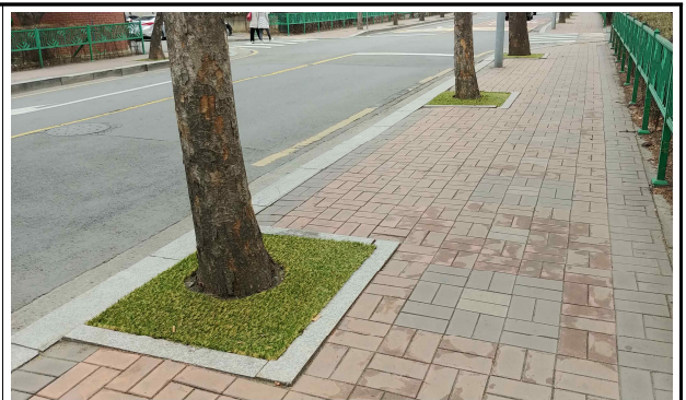
인조잔디 가로수 보호덮개