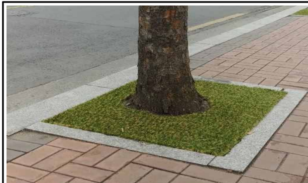
인조잔디 가로수 보호덮개