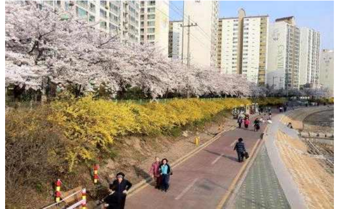
▲ 도봉구 우이천변(벚꽃, 개나리)