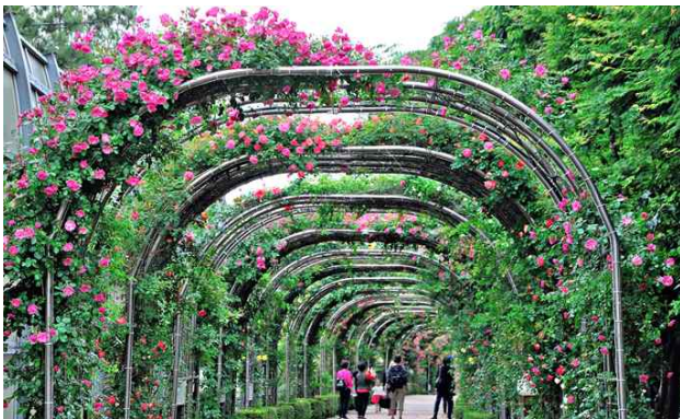
▲ 중랑구 중랑천 장미거리(장미)