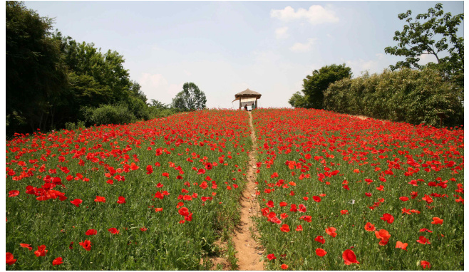
▲ 송파구 올림픽공원(꽃양귀비)