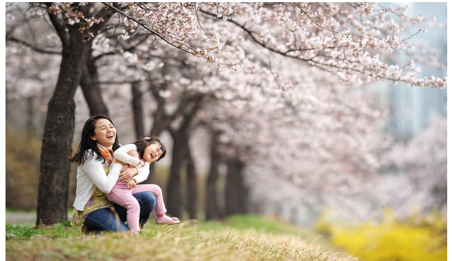
▲ 송파구 성내천길(벚꽃,개나리)