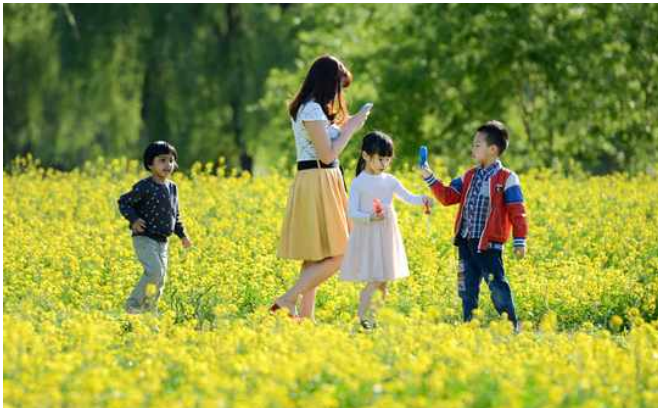
▲ 서초구 반포 서래섬(유채꽃)