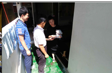
호우대비 시민행동요령 설명