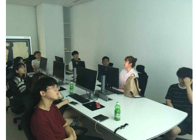
패션 맞춤형 교육