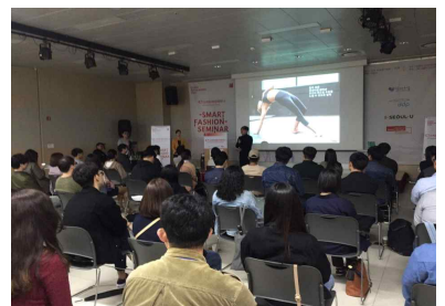
G밸리 패션지원 센터 전시 홍보