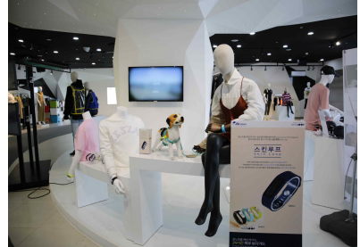
G밸리 패션지원 센터 전시 홍보