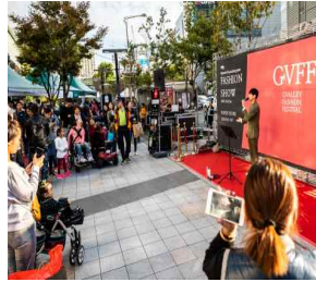
문화 예술 공연