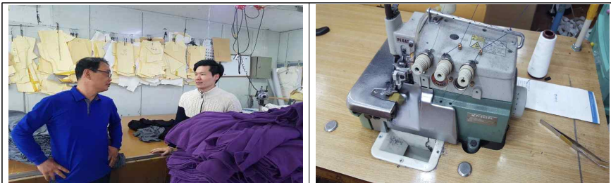
▲ 임대장비 확인 현장 실사