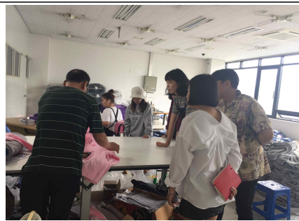
▲ 업체 현장방문(재단연계 - 미남미녀)