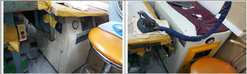
▲ 사례1 (순환식보일러 교체) 개선 전