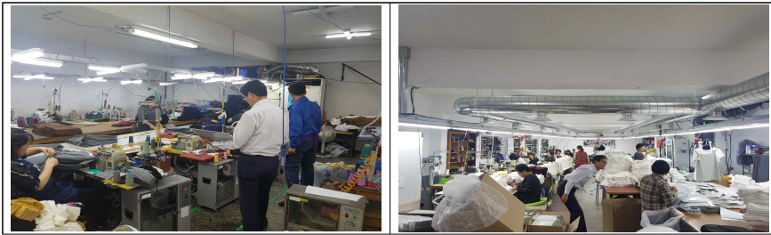
▲ 공장방문 환경개선 현장 실사1