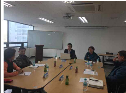
▲ 소그룹교육 컨설팅(집체교육)