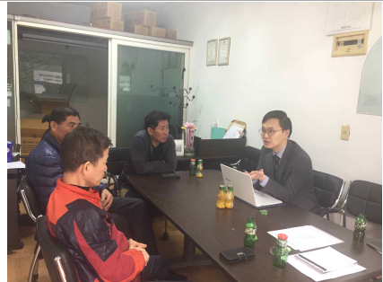
▲ 소그룹교육 컨설팅(업체방문)