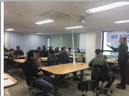
▲ 제조인프라지원사업 관련교육(3정5S)