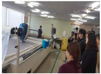
▲ 공용장비 관련교육(재단실 시연)