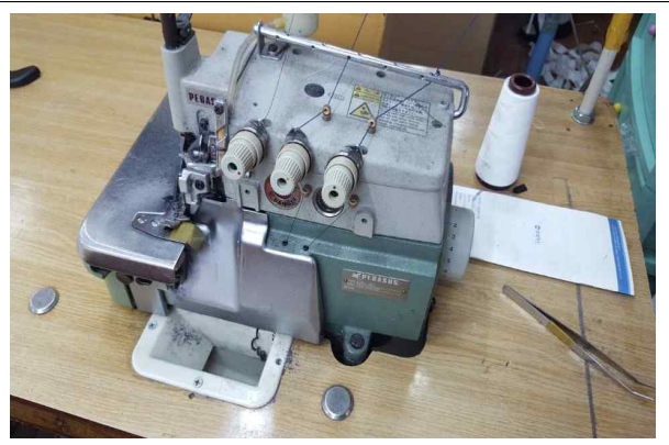
▲ 임대장비 확인 현장 실사