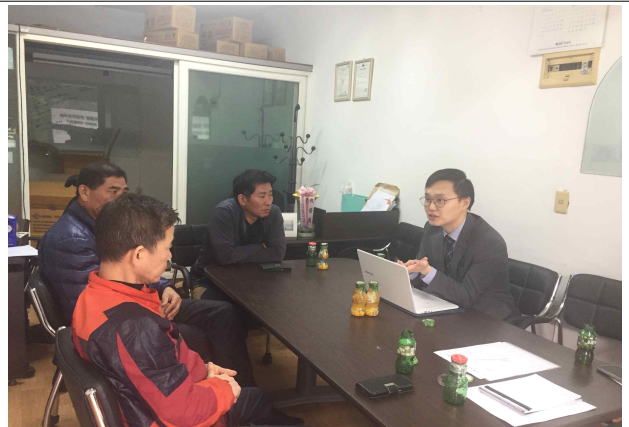
▲ 소그룹교육 컨설팅(업체방문)