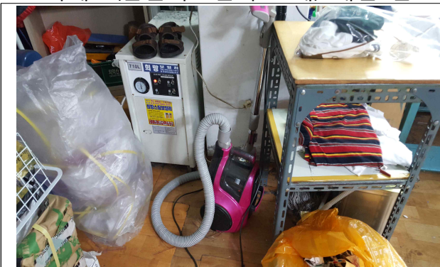
▲ 사례2 (청소기 교체) 개선 전