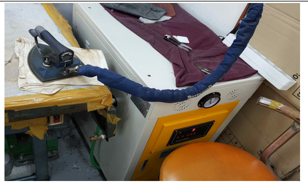
▲ 사례1 (순환식보일러 교체) 개선 후