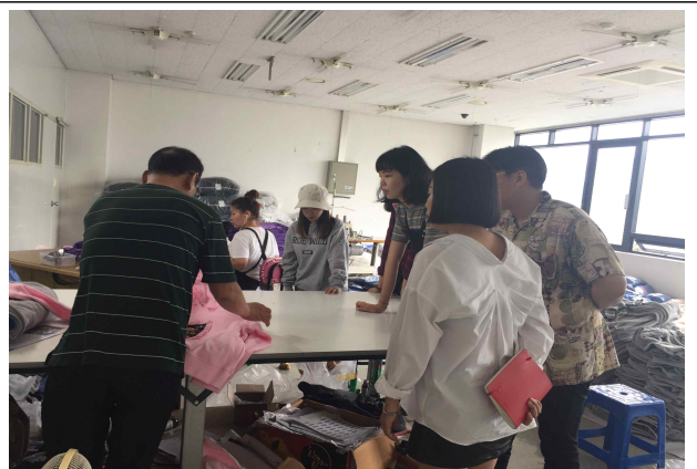
▲ 업체 현장방문(재단연계 - 미남미녀)