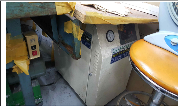
▲ 사례1 (순환식보일러 교체) 개선 전