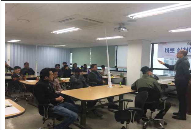
▲ 제조인프라지원사업 관련교육(3정5S)