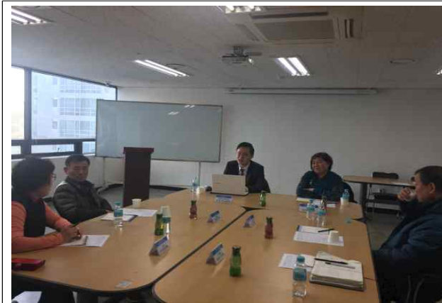
▲ 소그룹교육 컨설팅(집체교육)