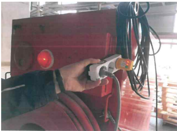
- 임시소방시설 접지