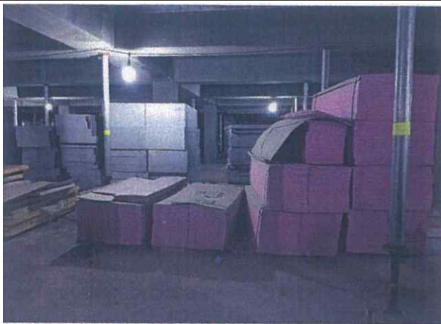
- 단열재 야적장 화재관리 철저