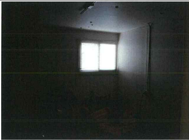
- 가설사무실 확산소화기 설치