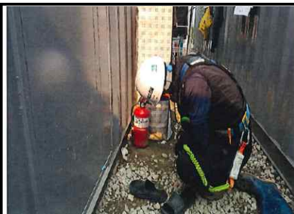
가설사무실 소화기 점검