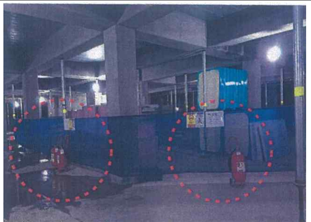
- 인화물질 주변 소화기 배치 완료