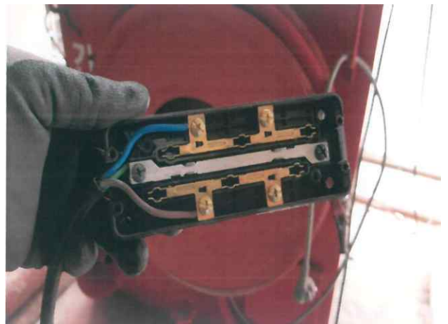
- 접지 완료