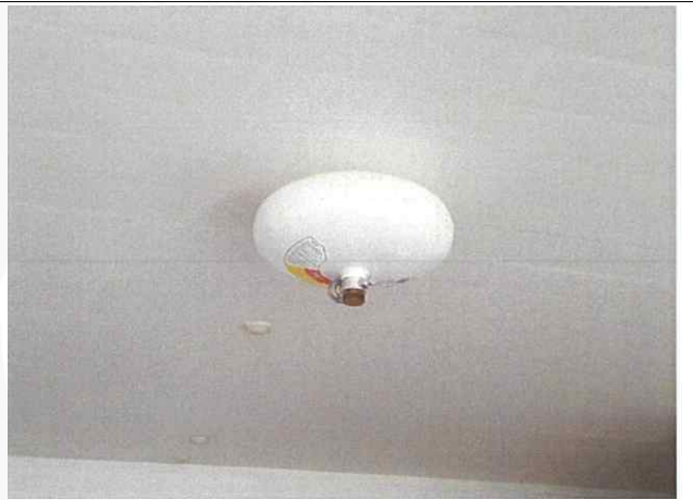
- 확산소화기 설치 완료