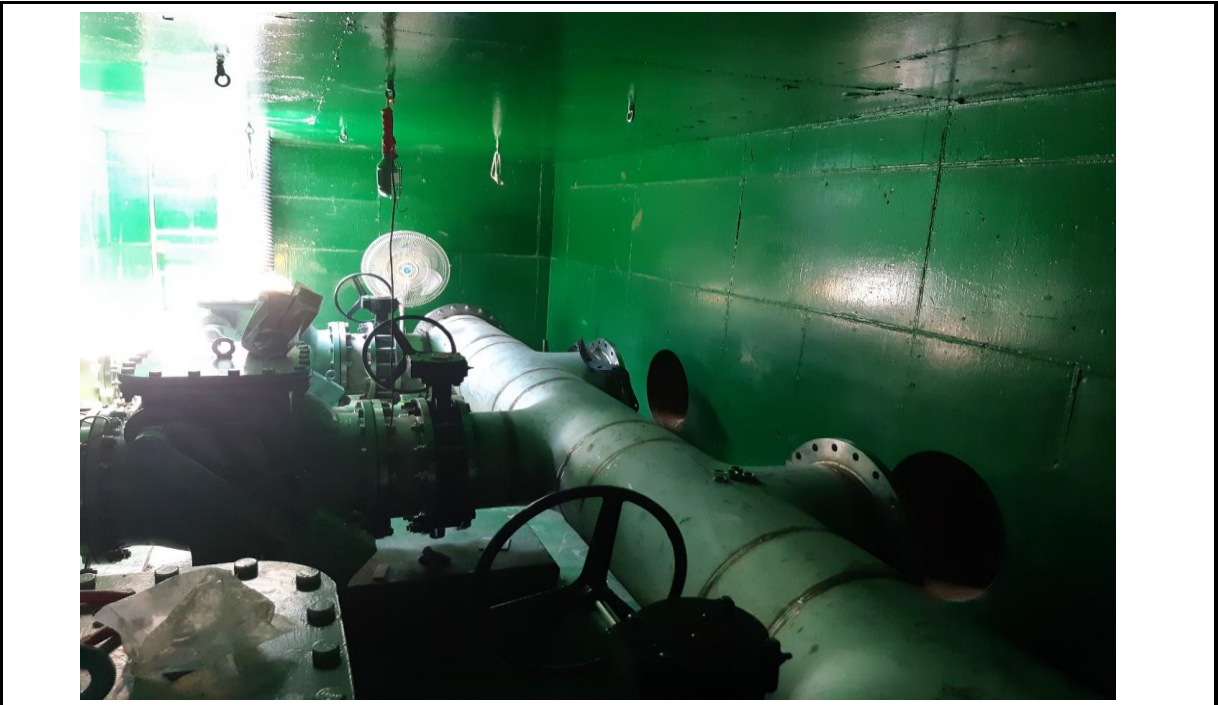
공사명 여의샛강 유입펌프장 증설공사