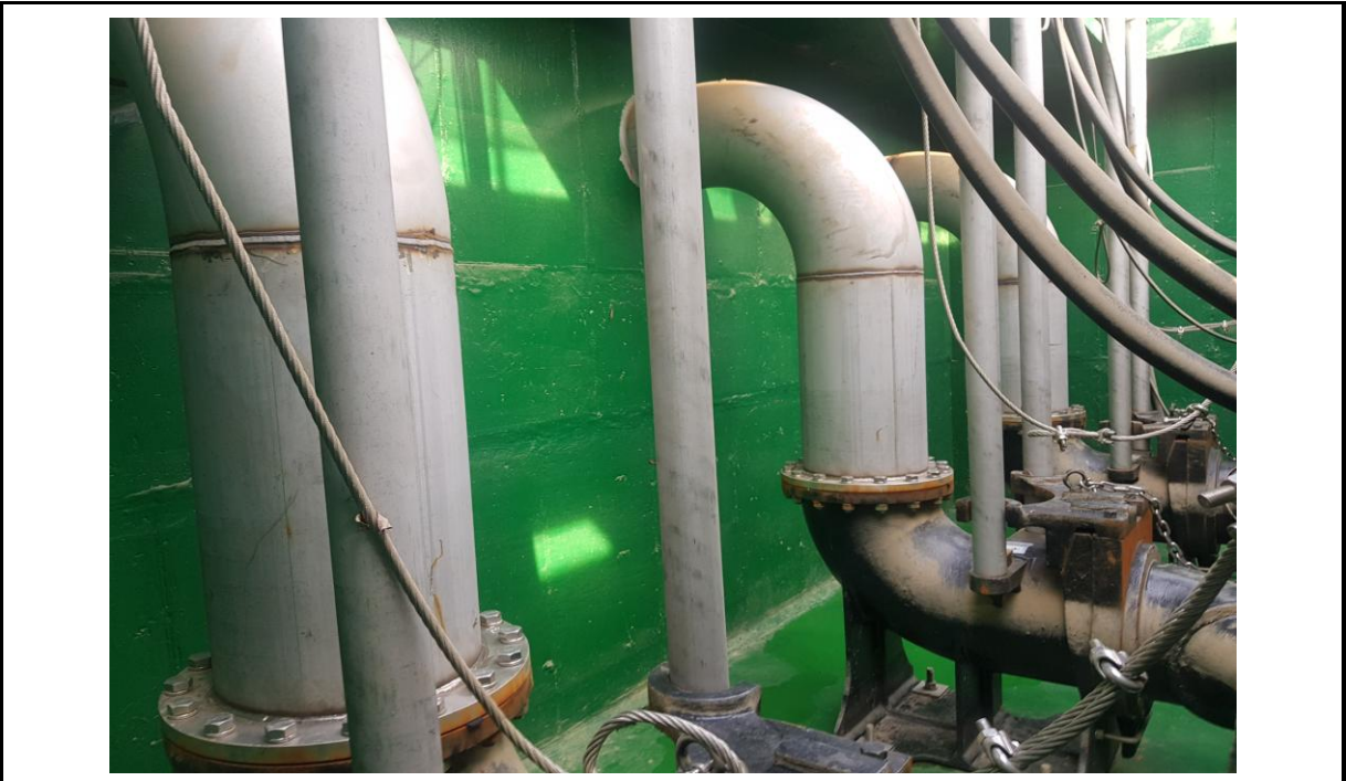
공사명 여의샛강 유입펌프장 증설공사