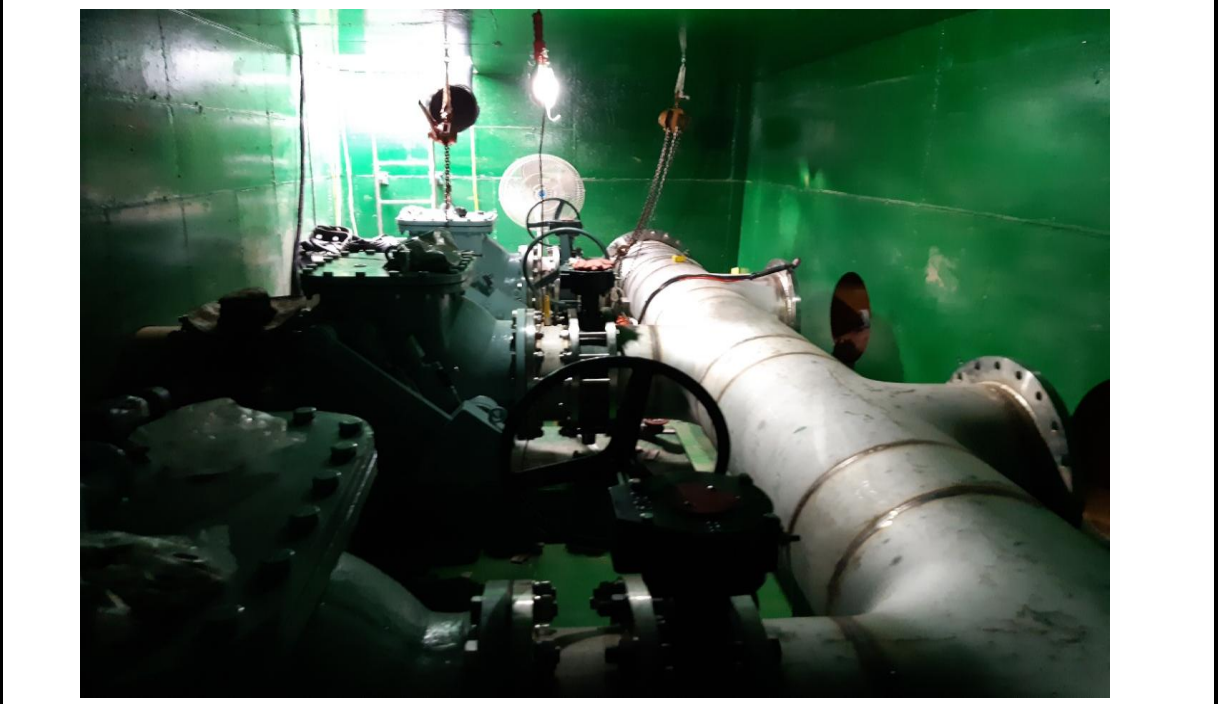
공사명 여의샛강 유입펌프장 증설공사