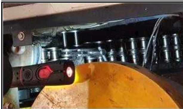
스텝 구동 체인