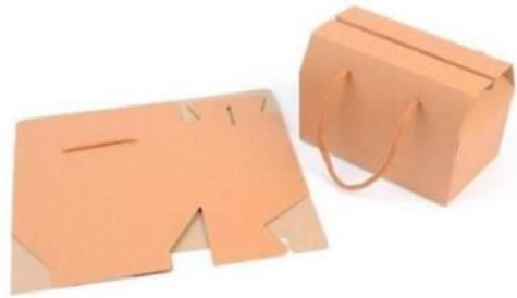
〈종이봉투 예시〉