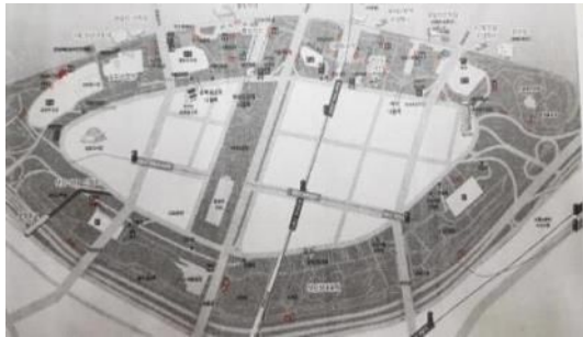
〈5월말 여의도한강공원 분리수거장소〉