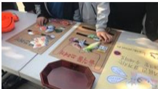
〈유넵엔젤 - 분리배출 게임〉