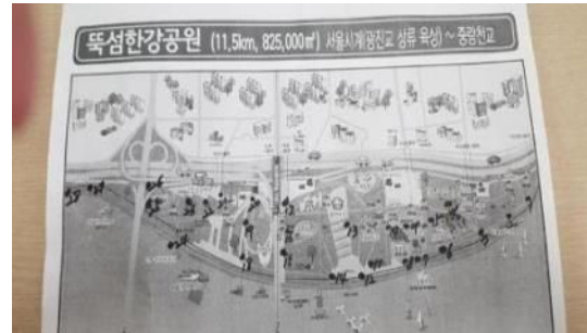
〈5월말 독섬한강공원 분리수거장소〉

※ 기초질서확립 대책으로 분리수거장소 확대 예정(7월) → 내용 반영 후, 봉투 제작