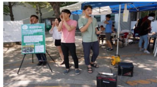
〈명지대그린캠퍼스 - 인식개선 캠페인〉