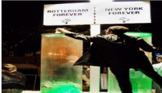
〈분리배출 투표 - 2014년 네덜란드의 위킵〉