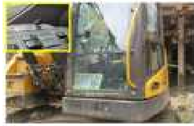
굴삭기 작업이 없을 경우 시동키 별도보관