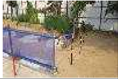
장터길 경사면 가설계단 및 난간대 설치 완료