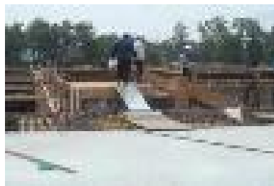
난간대 설치기준 미달 (추락재해 위험)