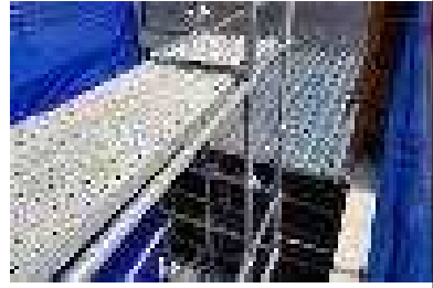
장터길 경사면 가설계단 및 난간 대 설치 완료