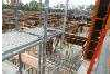
노들장터길 절토 사면부 근로자 작업통로 미설치