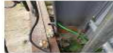
단자접속부 절연조치 완료 및 외함접지 접지봉 매설상태 보완 완료