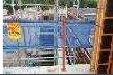
기준 미달(수평길이부족) 난간대 재설치 후 보호망 설치완료