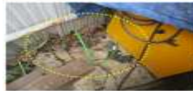
단자접속부 절연조치 및 외함접지 접지봉 매설상태 보완