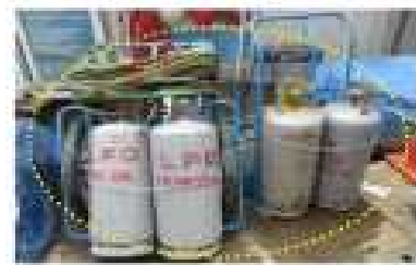
가스대차 사용시 소화기 향시 비치