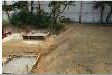
노들장터길 절토 사면부 근로자 작업통로 미설치