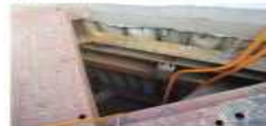
자재 및 펌프이동조치 완료