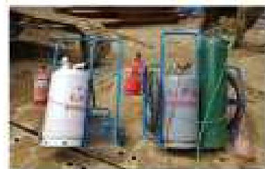
가스대차 사용시 소화기 향시 비치 완료