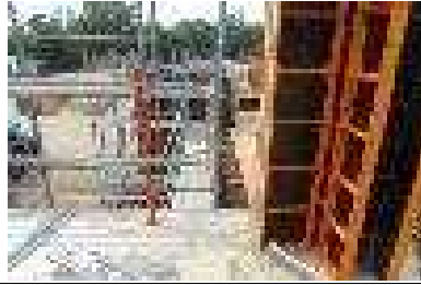
난간대 설치기준 미달 (추락재해 위험)