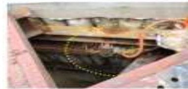
낙하, 비례재해예방 자재 및 펌프 추락위험이 있어 안전조치 할 것