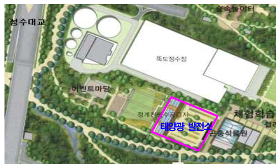
태양광 발전시설 위치도