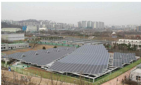
태양광 발전시설 전경사진