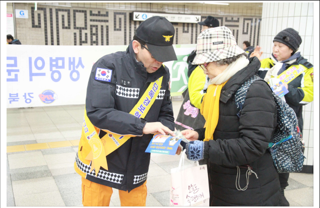
「주택용 소방시설」 설치 홍보