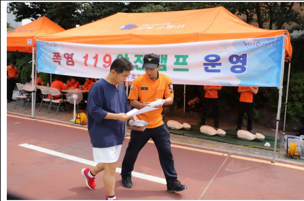
아리수 병물 제공 및 폭염 전단지 배부