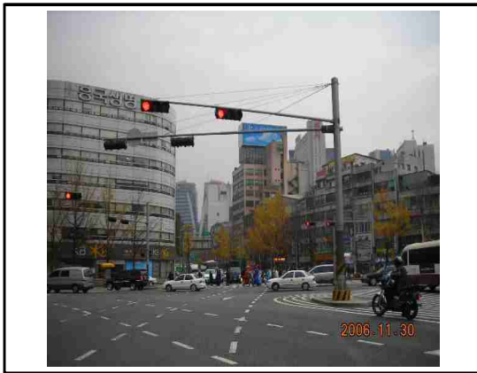
〈사진 1. 주변배경과 함께 촬영〉