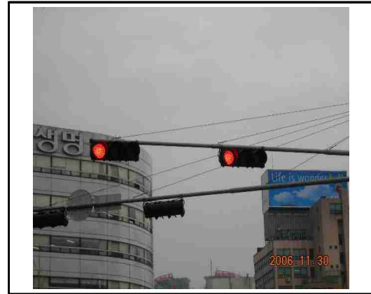
〈사진 2. 시설물 근접 촬영〉