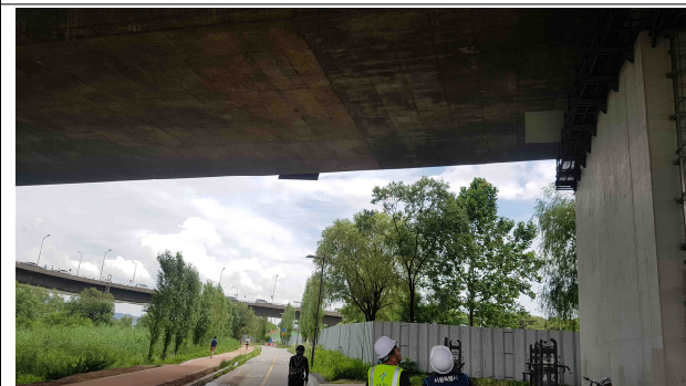
공 사 명 : 2017 한강교량 일상유지 보수공사 공사내용 : P5~P6, P18 빗물받이 유도배수 설치 점검결과 : 설치상태 양호