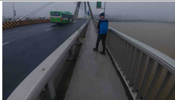
공 사 명 : 한강PSC교량 안전감화공사 공사내용 : 보도부 단면 보수 점검결과 : 단면보수 양호