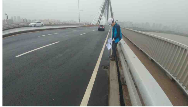
공 사 명 : 한강PSC교량 안전감화공사 공사내용 : JA1~A1, P6~P10 방수 및 포장 점검결과 : 포장상태 양호