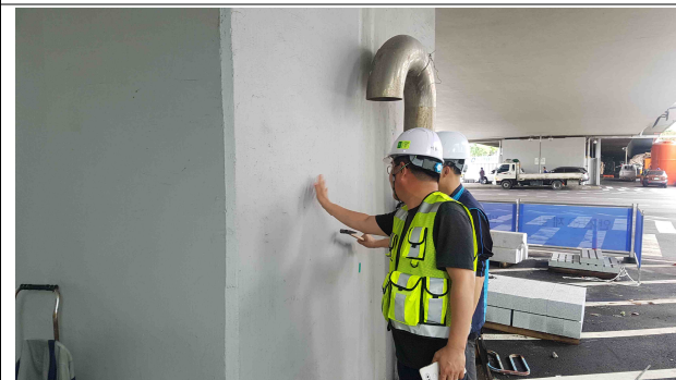
공 사 명 : 2017 한강교량 일상유지 보수공사 공사내용 : JA1~A1 상부 측면 및 교각 표면보수 점검결과 : 보수상태 양호