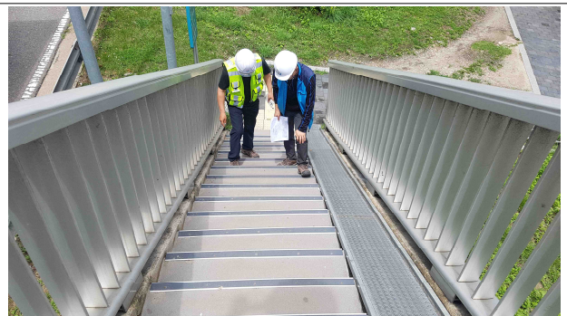
공 사 명 : 2017 한강교량 일상유지 보수공사 공사내용 : 남단 교량 진입 계단 정비 점검결과 : 정비상태 양호