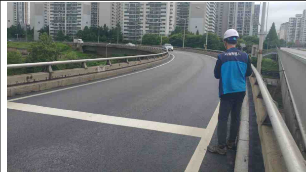
공 사 명 : 2016 한강교량 일상유지 보수공사 공사내용 : A1~P5, B램프 방수 및 포장 점검결과 : 포장상태 양호