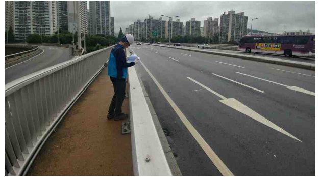
공 사 명 : 한강PSC교량 안전감화공사 공사내용 : 사장교구간 보차도 경계석 보수 점검결과 : 콘크리트 경계석 설치 양호