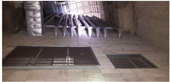
(OA실 지하3층에서 상부구조물 확인)