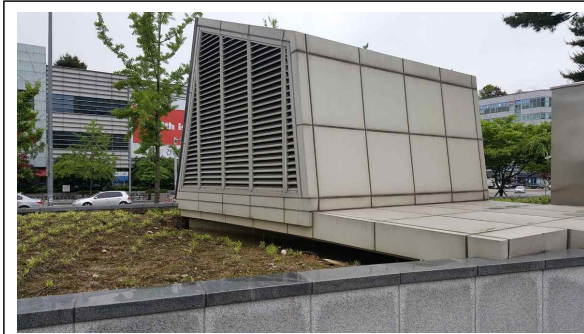
(누수점포 직상부층에 위치한 지상1층 녹지대 OA구조물)