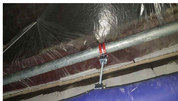
(전문시공업체에서 천장속 낙수물이 OA실로 낙수되도록 비닐 설치)