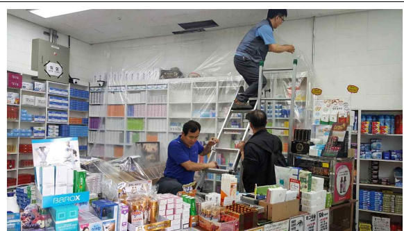
(자회사 누수현장 보양)