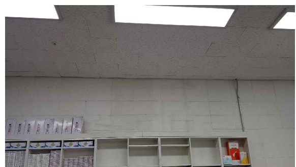
(전문시공업체에서 천장재 복구)