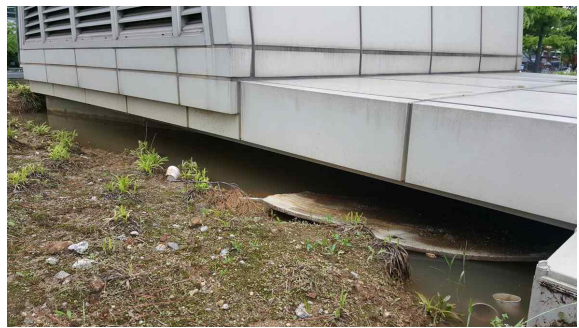
(녹지대 배수불량으로 물고임)