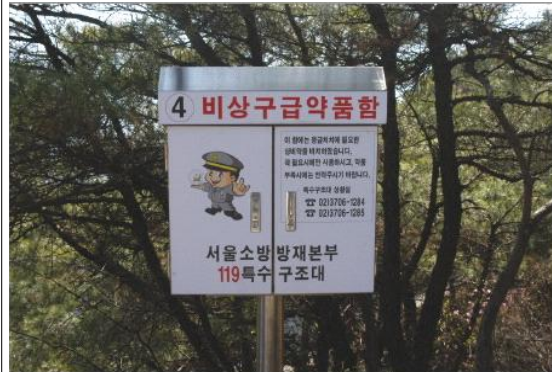
④ 수락산 치마바위