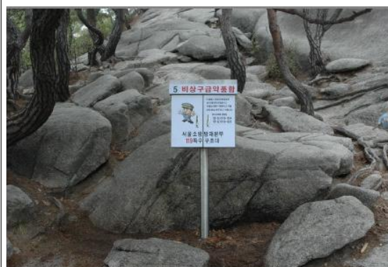
⑤ 불암산 거북바위