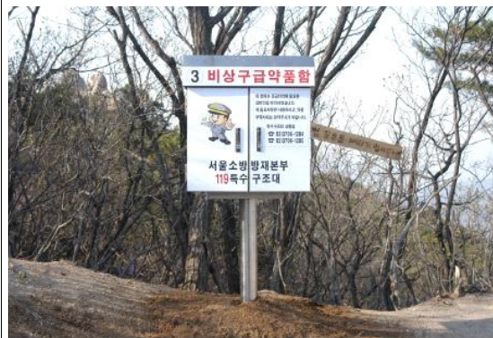
③ 수락산 철모바위