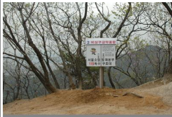
② 수락산 진달래능선 곰바위