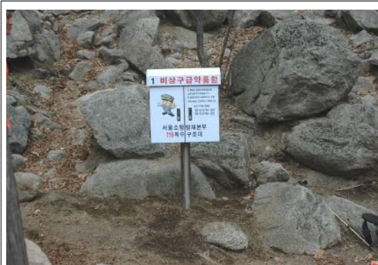
① 수락산 큰바위샘