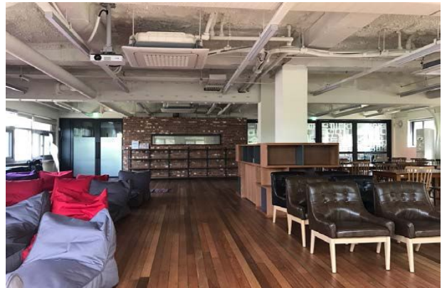
< 맛동내관 : 2층>