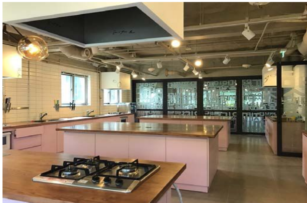
< 맛동내관 : 2층>