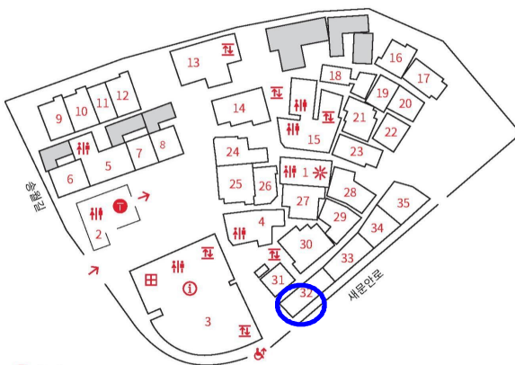
돈의문 박물관 마을내 위치