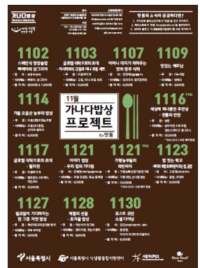
< 프로그램 홍보 포스터>