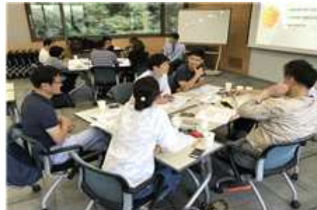
부서장 2차 교육진행 모습