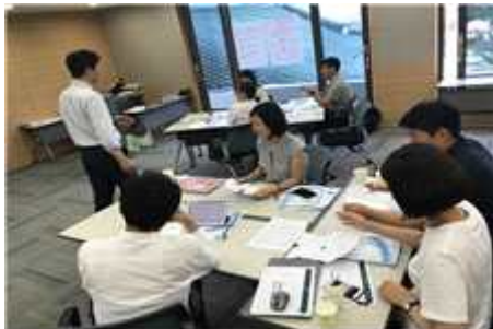
부서장 1차 교육진행 모습