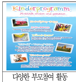
다양한 부모참여 활동