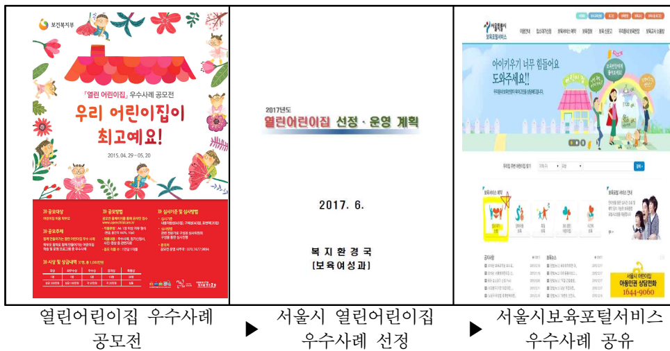
■ 그림 IV-2 ■ 열린어린이집 우수사례 공모, 선정 및 공유 플랫폼 제안

집 우수사례에 대한 공모 및 선정이 이루어지고는 있으나, 우수사례에 대한 공유가 되고 있지 않아 현장에서 부모참여 열린어린이집 사업 활성화에 소극적이라고 할 수 있다. 서울시는 열린어린이집 우수사례 공모, 선정, 결과를 서울시보육포털서비스와 자치구 육아종합지원센터를 통해 적극 홍보하고 공유할 것을 제안한다. 이와 같은 공유 플랫폼은 자연스럽게 부모참여 열린어린이집 활성화에 기여할 것이다.