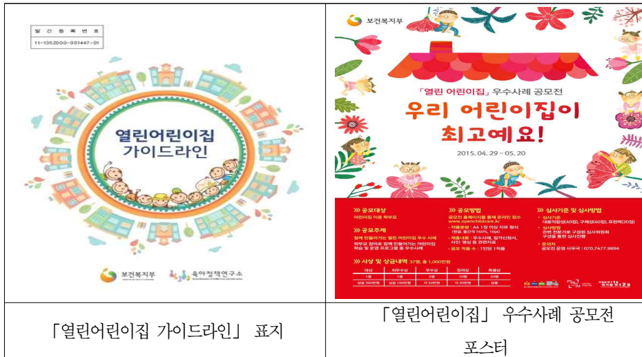
■ 그림 II-1 ■ 열린어린이집 가이드라인 표지 및 우수사례 공모전 포스터

매월 둘째 주 수요일을 부모와 어린이집이 상호 소통하는 날로 지정한 서울시 「열린어린이집의 날」 은 상시 개방을 원칙으로 하며, 영유아 부모 등 보호자를 포함한 지역주민에게 어린이집을 개방하여 ‘함께 체험하는 날’ 로 운영하도록 하고 있다. 참여 프로그램으로는 1일 보육체험, 급식체험, 활동도우미(산책, 실외놀이, 나들이), 자유선택활동 영역 도우미(언어영역 책읽어주기), 기타 재능기부(장난감 만들기, 환경정비) 등 다양한 체험활동으로 구성되어 있다 9) . 「열린어린이집의 날」 지정 및 정례화 외 기타 부모참여 활성화 내용으로는 어린이집 운영위원회, 신입생 오리엔테이션 부모참여, 부모상담 및 교육을 통한 부모와 교사의 소통 강화 등을 포함하고 있다.