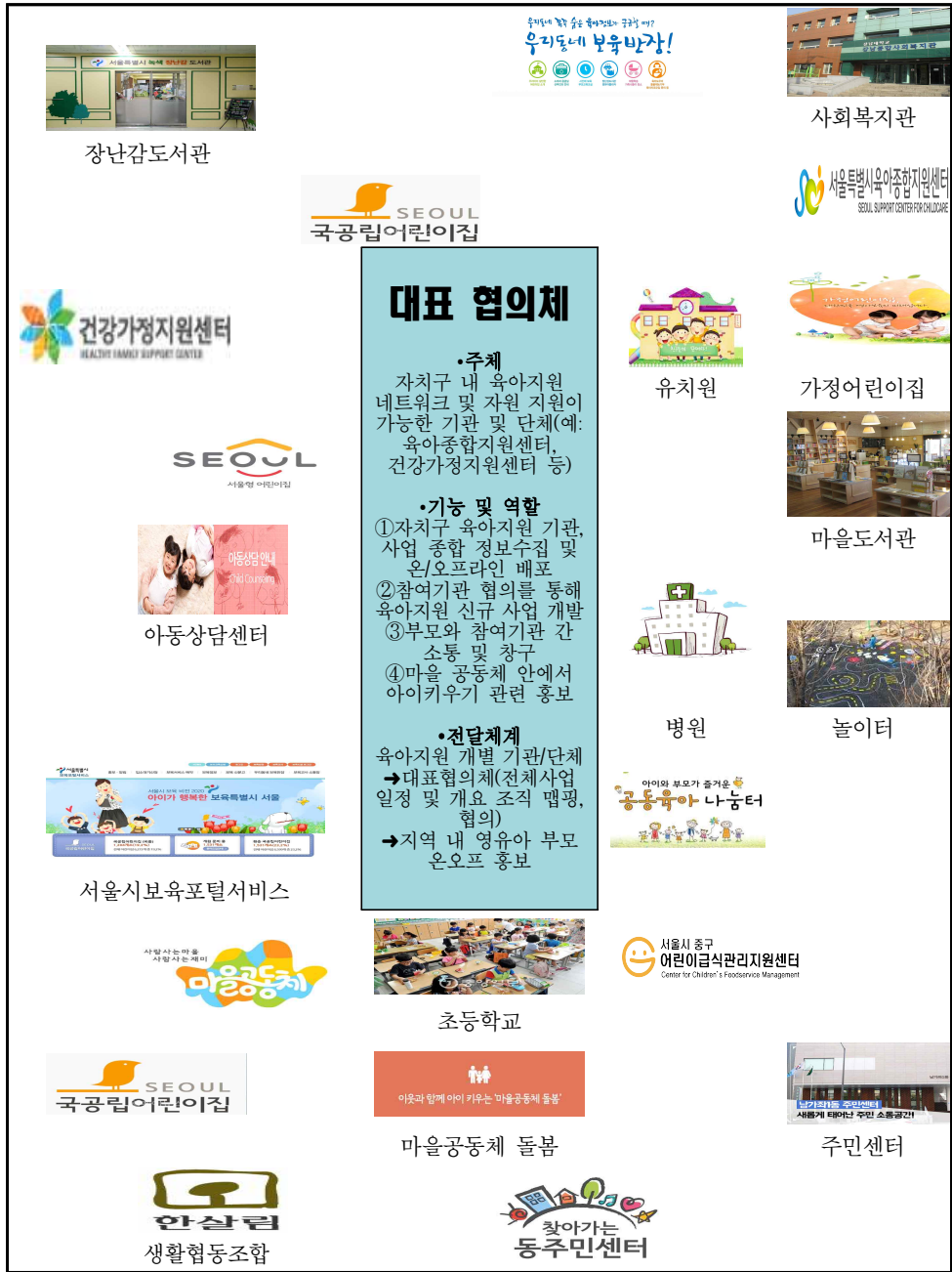
【그림 IV-3】 지역 내 육아지원 인프라 플랫폼 모형(안)