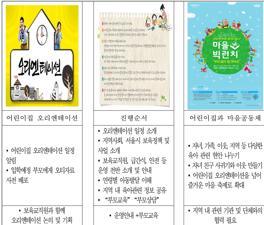
표Ⅳ-3 | 어린이집 오리엔테이션 기획(안) 제안

한편 부모상담은 내 아이를 맡고 있는 교사와의 만남의 시간이기 때문에 부모와의 대화와 신뢰 형성 방법을 위한 다른 접근방식이 필요한 분야라고 할 수 있다. 교사의 역량이 확인되고 발휘되는 지점이며, 부모가 안심하고 자녀를 맡겨도 되겠다는 확신이 생길 수 있는 기회이기도 하다. 실제로 부모상담은 부모와의 대면 방법, 의사소통 방식, 아이 관련 내용의 적절한 전달, 교사의 보육/교육적 철학이 나타나는 매우 전문적인 영역이다. 따라서 열린어린이집 활성화의 성패가 보육교사의 역량과 밀접하게 관련되어 있다는 점에서 부모상담 등 부모 관련 분야에 대한 보육교사 역량개발이 매우 필요하다. 교사 역량강화를 위한 교육과정 수립 시 특히 주의할 점은, 업무처리를 위한 부모상담 교육에 초점을 두기 보다는 부모에 대한 이해, 인간관계 형성, 의사소통 기술 등 전반적인 교사 인성 및 역량을 키울 수 있는 교육