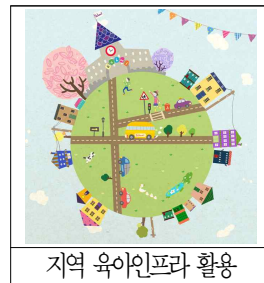
지역 육아인프라 활용