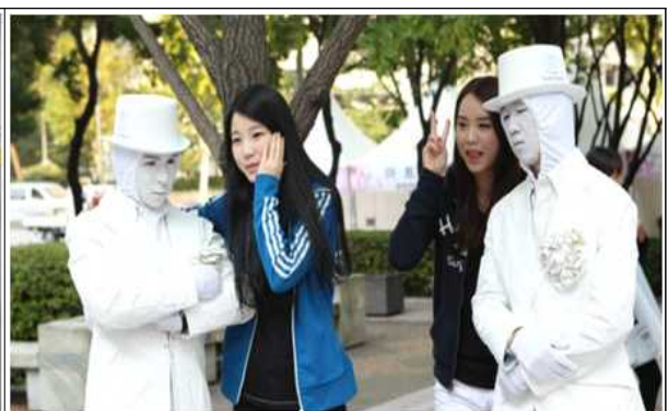
거리 마임 퍼포먼스