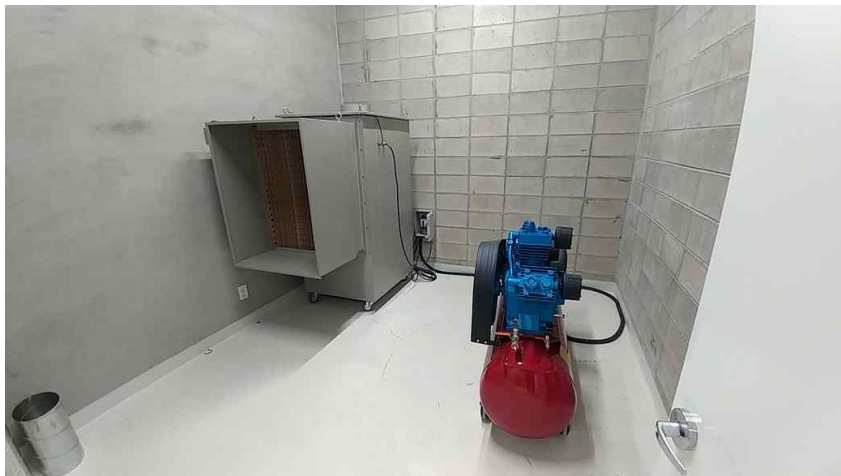
도색용 집진기, 10마력 에어프레셔