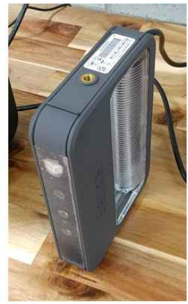
PC 2대, 3D 스캐너