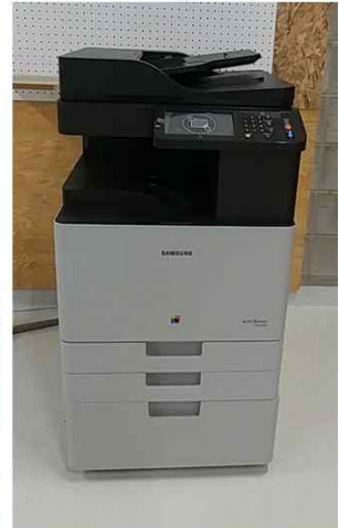
PC 3대 , APEX G 포스기, 복합기