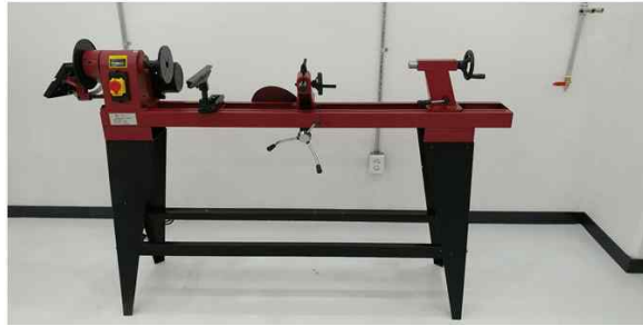
디스크샌더, 드럼샌더, 테이블쏘, 목공용선반