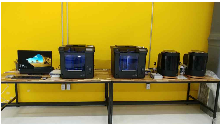
큐비콘싱글 플러스 2대, 큐비콘 럭스 2대