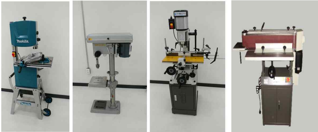
밴드쏘, 드릴프레스, 각끌기, 자동수압대패기