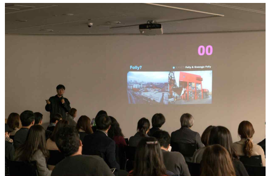
[ DDP지식공유세미나 ]