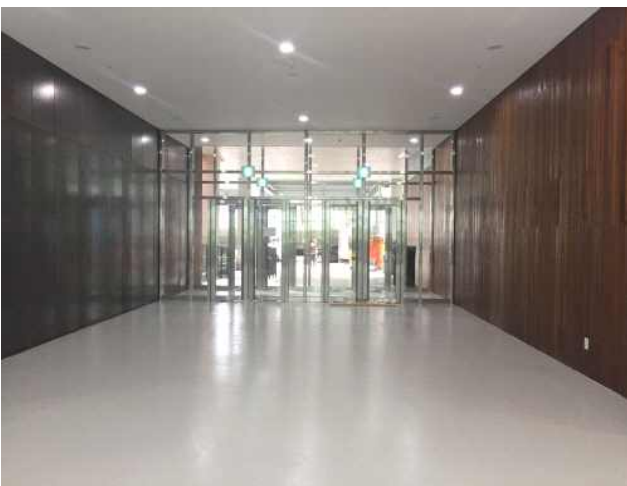
• 지상1층 정문 출입구 : 로비와 연결되고 방문객이 가장 처음 접하는 공간