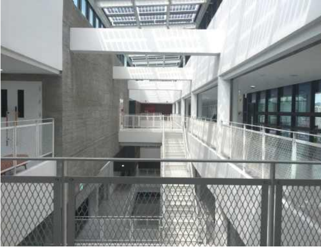
• 로비 상부는 천창으로 구성되어 지상1층에서부터 5층까지 오픈되어 있음