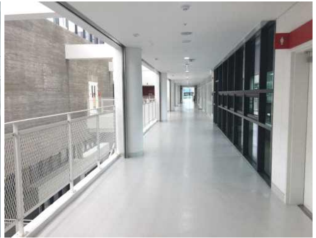
• 지상5층 복도공간 : 방문객의 주요 이동통로