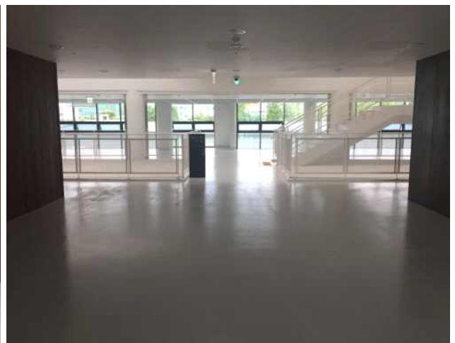
• 지상2층 출입구(전면 계단과 하수도 과학관 연결) : 하수도 과학관 관람객들이 처음 경험하는 공간