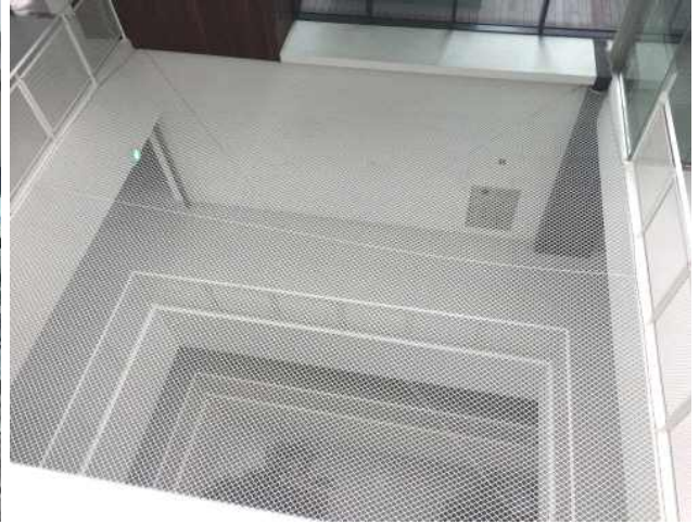
• 로비 상부 중정공간 : 추락방지를 위한 안전망이 설치됨