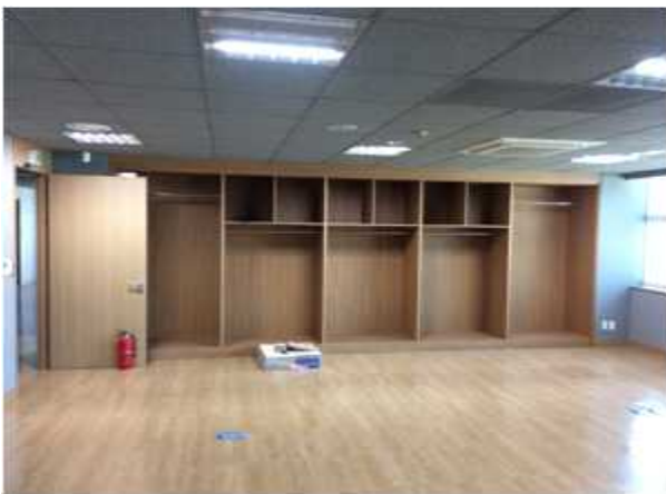
위 치 : 성장기기업 공용공간