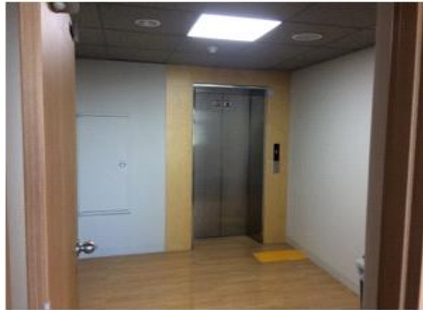
위 치 : 엘리베이터 홀