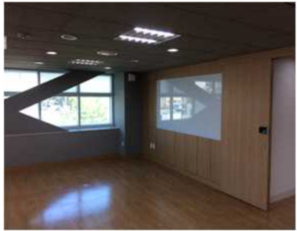
위 치 : 세미나실