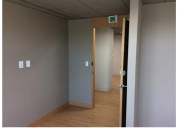
위 치 : 스타트기업4