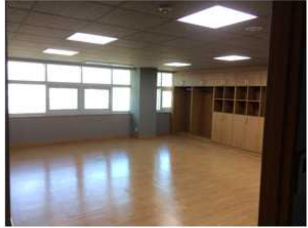
위 치 : 성장기기업2