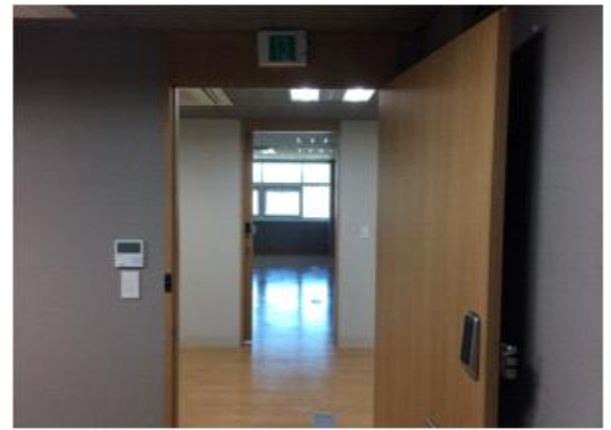
위 치 : 스타트기업3