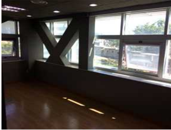
위 치 : 스타트기업4