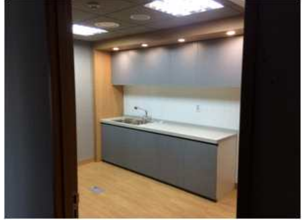
위 치 : 탕비실