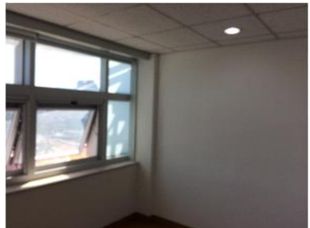
위 치 : 촬영실