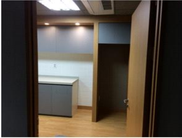
위 치 : 탕비실