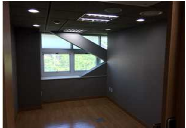
위 치 : 스타트기업2