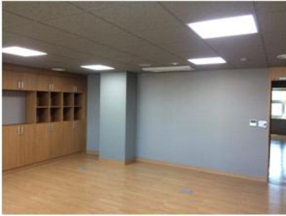
위 치 : 성장기기업2