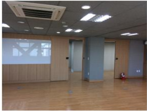
위 치 : 세미나실