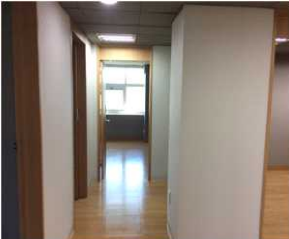
위 치 : 공용복도