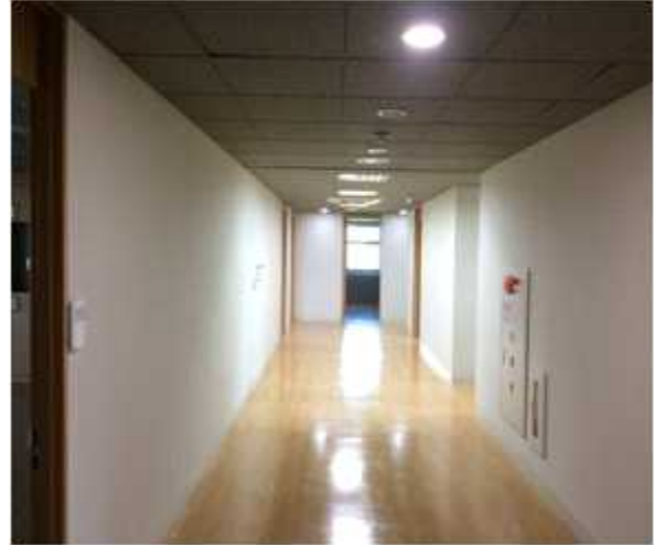
위 치 : 공용복도