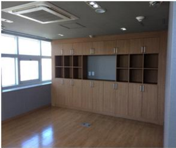
위 치 : 운영사무실