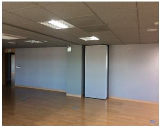
위 치 : 성장기기업 공용공간