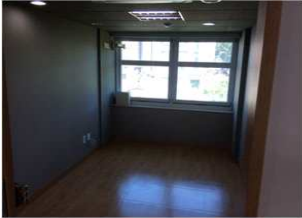
위 치 : 스타트기업1