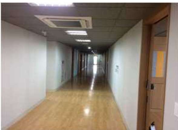
위 치 : 공용복도