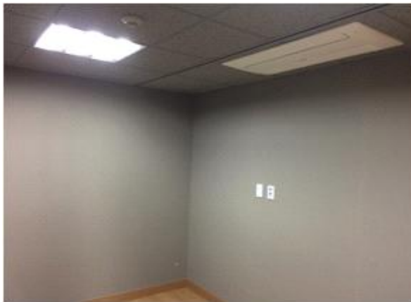
위 치 : 스타트기업3