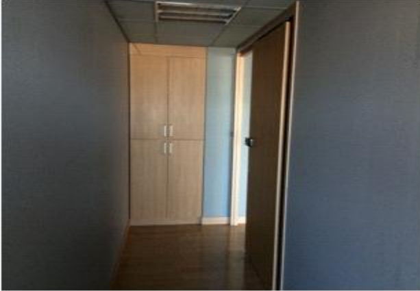
위 치 : 창고