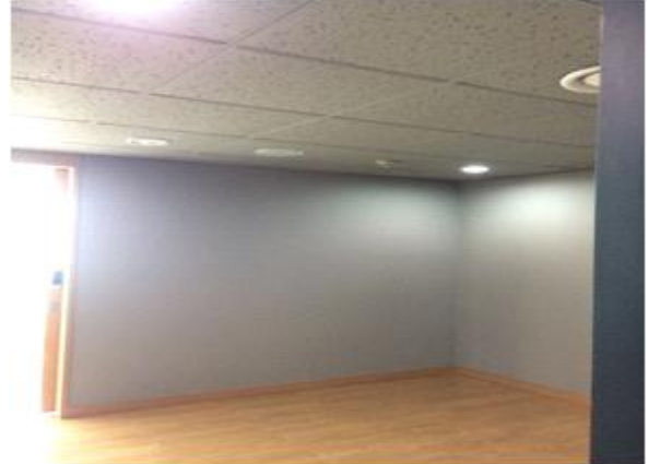
위 치 : 창고