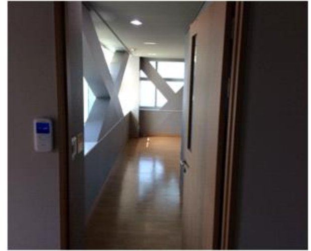
위 치 : 운영사무실