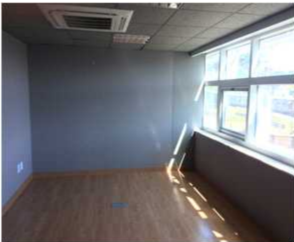
위 치 : 스타트기업5