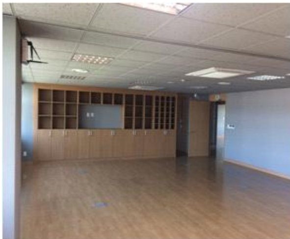
위 치 : 성장기기업1