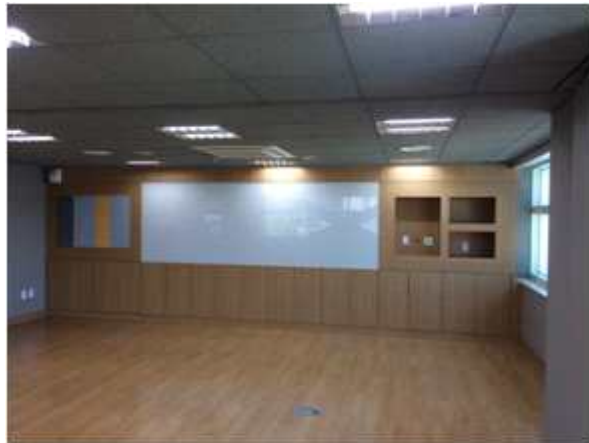
위 치 : 세미나실