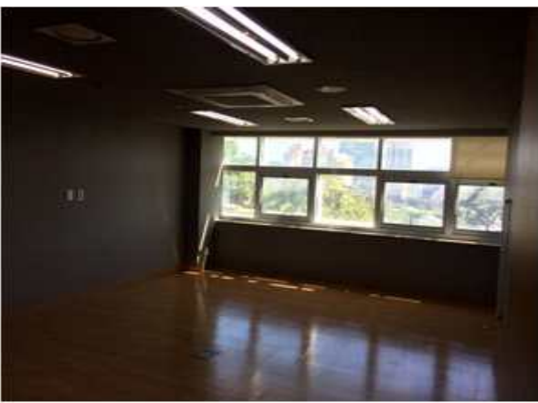
위 치 : 인큐베이팅실