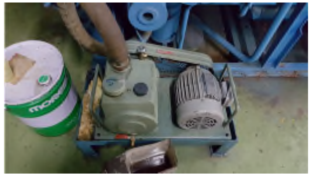
진공펌프 소음 및 성능 저하