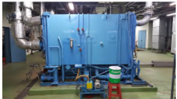
냉동기 보온재 및 도색 소손