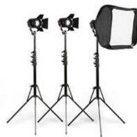
Fillex 3Light Kit