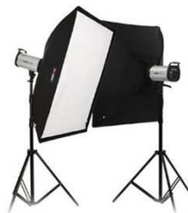
Fomex HD1000p SS