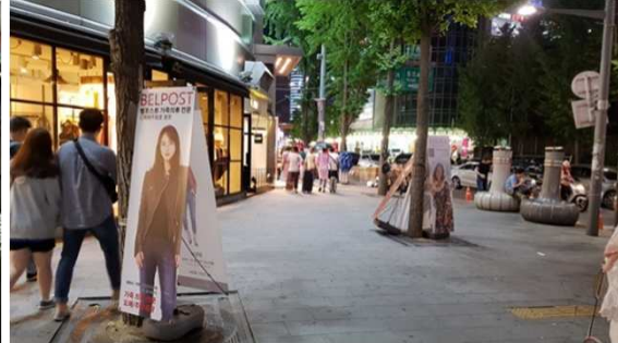
[참고이미지-어울림광장, 동대문역사문화공원, 도매시장 인근]