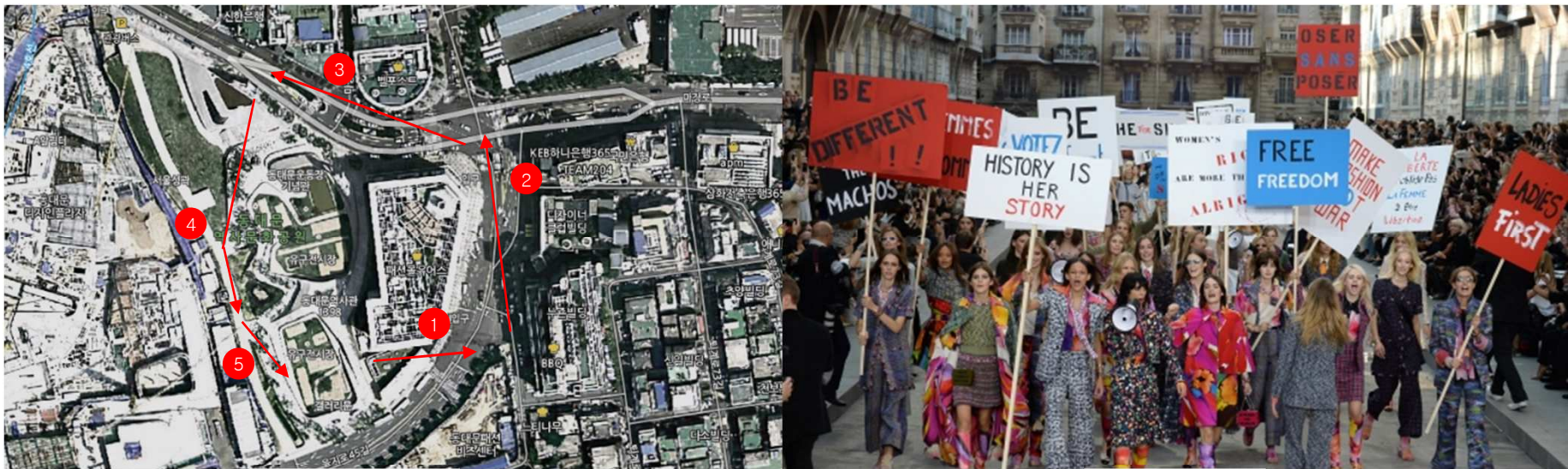
<모델 이동 동선>

패션쇼 및 이벤트 스튜디오 시민 유입을 위해 모델들을 활용한 피켓 홍보 진행