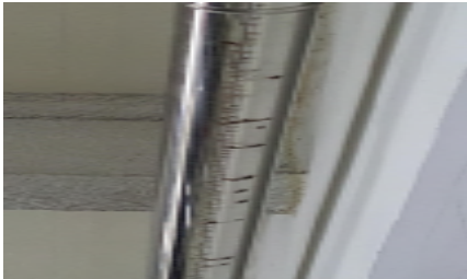
(우수관 부식으로 우수관구멍 발생)

3. 또한, 가락물 스텐우수관 부식으로 누수가 발생하여 귀사에서 시공하신 가락물 스텐우수관을 공인시험기관(한국화학융합시험연구원)에 품질시험 의뢰한 결과 KS규격에 부적합한 것으로 판명되었습니다. 우수관 누수로 인한 미끄럼사고를 유발할 우려가 높아 안전사고 예방을 위해 귀사에서 부적합 자재로 시공하신 가락물 스텐우수관을 KS규격에 적합한 자재로 2017년 8월 31일까지 재시공하여 주시기 바랍니다.