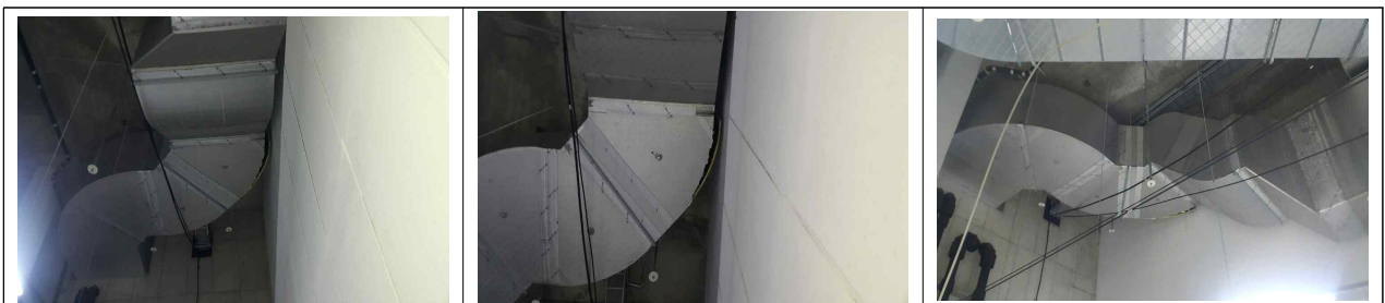
알림관 공조덕트 파손