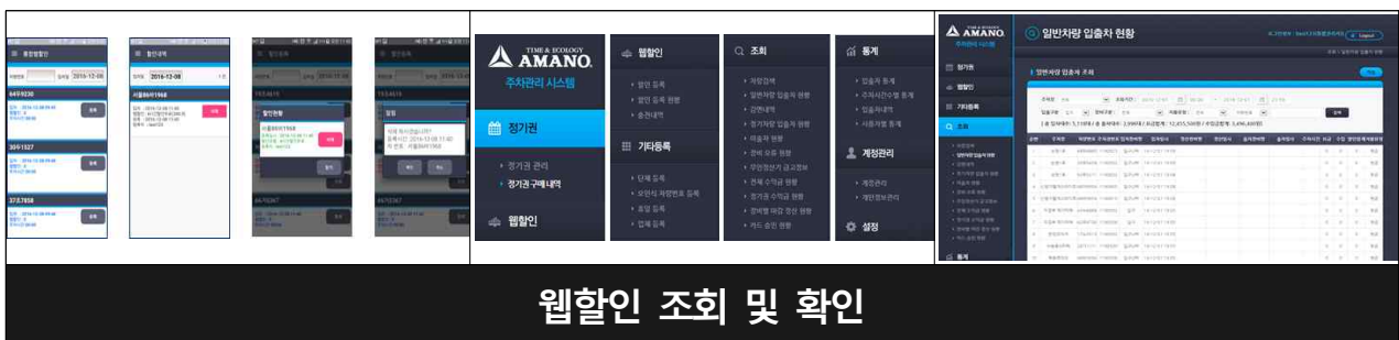
웹할인 조회 및 확인