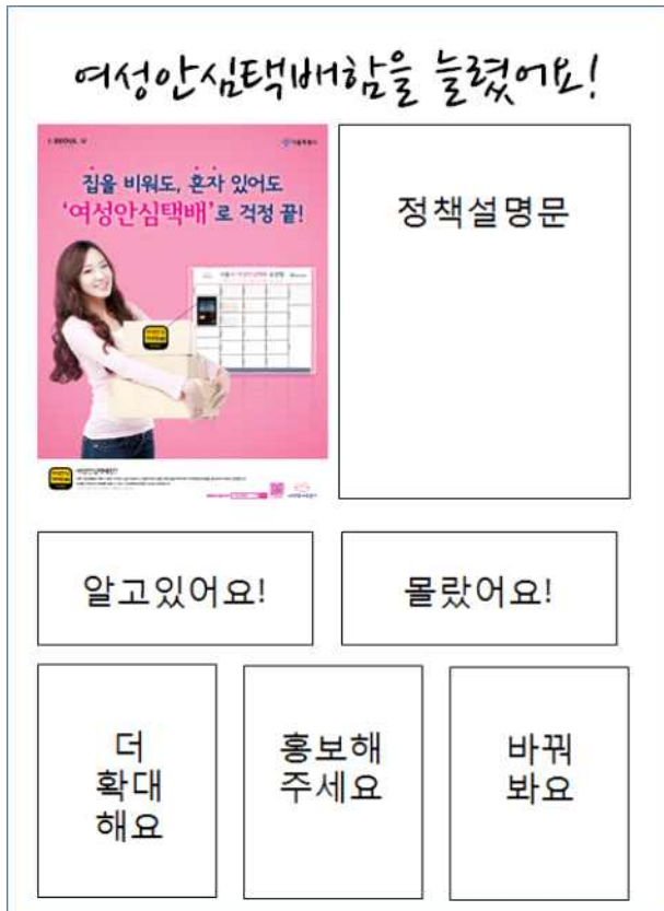
서울시 여성안전정책 시민 투표판