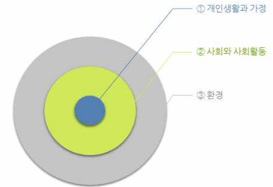
[표10. 신규 생활지표의 대영역]