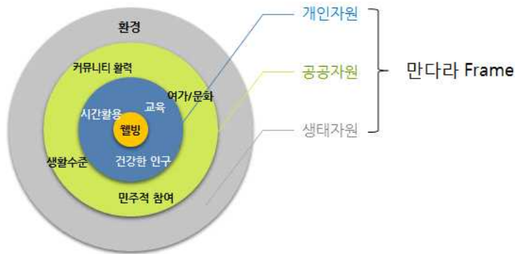
[표12. The Mandala of Wellbeing]

- 이러한 영역 구분은 서울시민의 관점에서 서울생활의 전체상을 구성하는데 적절하다고 판단되며, 캐나다 행복지표에서 사용하는 「The Mandala Frame」 체계를 원용했음