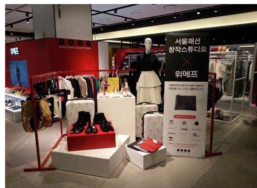
< 서울 새활용展, 현대시티아울렛 위메프관 현장사진 >