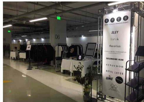
< 시즌오프 팝업 제너레이션넥스트 서울 현장사진 >