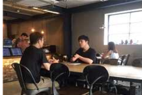
< 교육지원 멘토링 현장사진 >