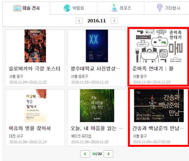
<네이버 '전시행사' 검색시 노출>