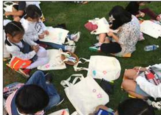
에코 백 만들기