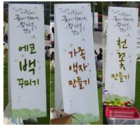
어린이 공예디자인 창의력 캠프 리플렛