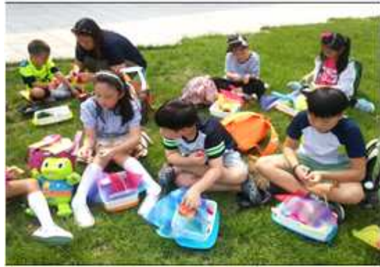
천 꽃 만들기