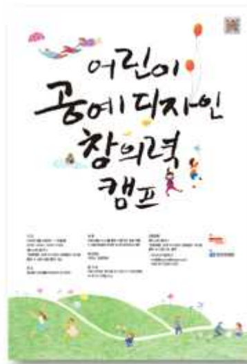
어린이 공예디자인 창의력 캠프 포스터