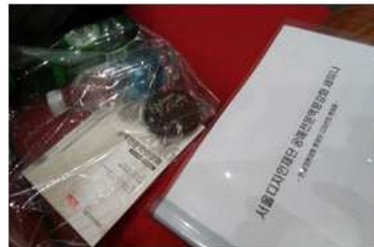
세미나 강의 자료집 및 다과