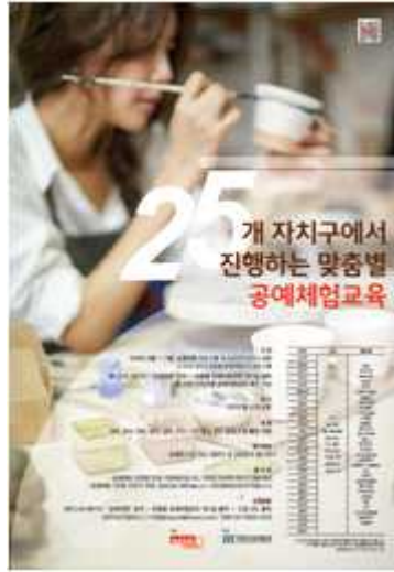
맞춤형 공예체험교육 포스터