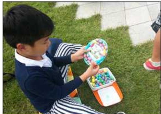
가죽 액자 만들기