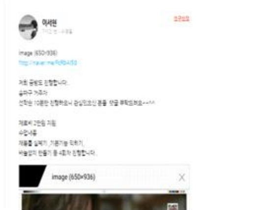
페이스북, 블로그 홍보