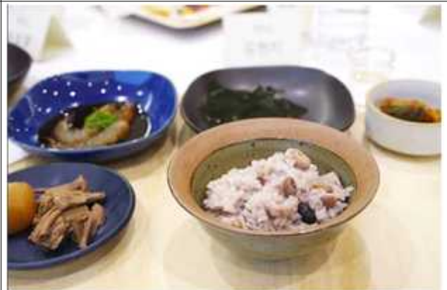
'밥&그릇'_생활의 발견 밥그릇 파티 현장사진 이미지