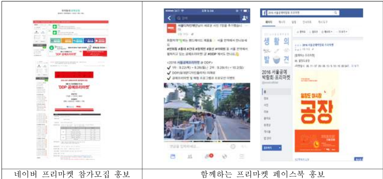
네이버 프리마켓 참가모집 홍보

- facebook '2016 서울공예박람회&서울공예프리마켓, 서울디자인재단 공지