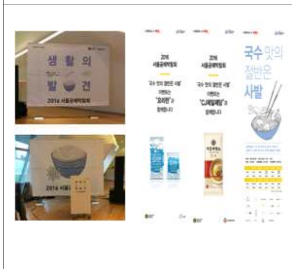
T베너, 포디움 보드, 베너