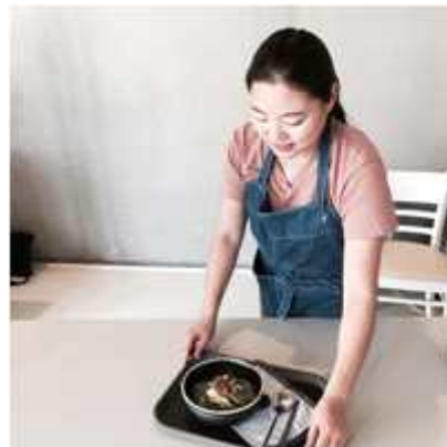
국수 이벤트 현장사진 이미지