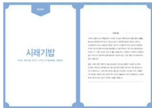
10가지 밥 소개자료