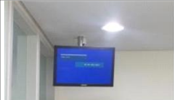
화장정보 표출불량(메인보드 고장)