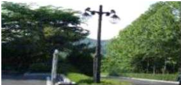
승화원 노후 보안등 1