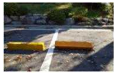
승화원 주차블럭 파손