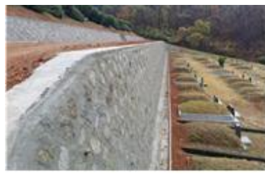
석축상부 안전휨스 설치