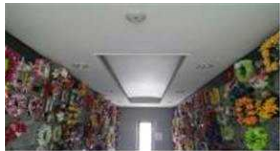
납골실 전등 (일반 13W×2 10개, 간접등 28W 8개)