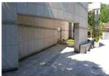
제레단 추가 설치(개선)