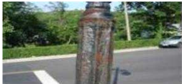
승화원 노후 보안등 2