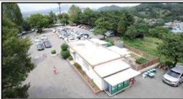
관리소부지 및 주차장 전경