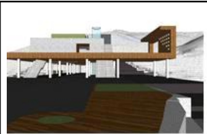
다목적 복합 웰컴센터 기본구상 및 계획(예시)