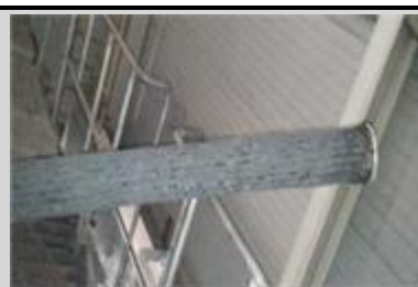
백필터 눈막힘 현상