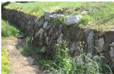
용미2묘지 석축배수로 파손