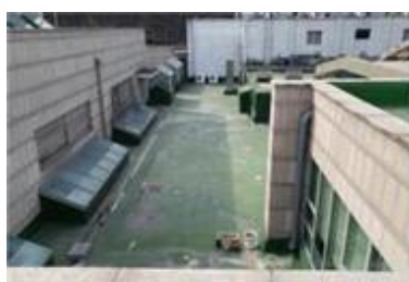
지붕층 방수슈트 파손(노후)