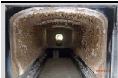
세라믹화이버 손상 모습