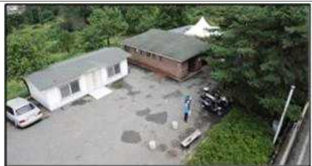
교육실 및 화장실 전경