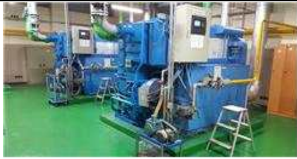
흡수식 냉·난방기('00년 설치)