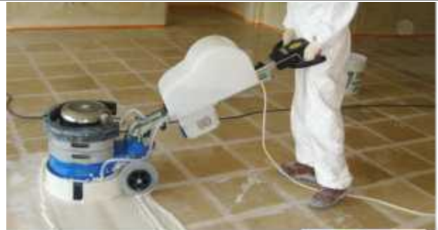
대리석 연마 및 광택작업