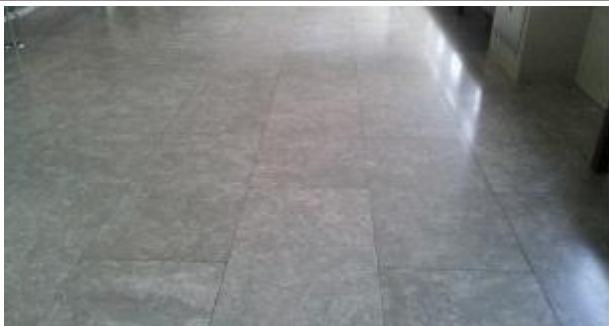
추모공원 바닥대리석 사진