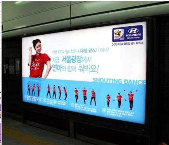
<지하철 PSD 광고 예시>