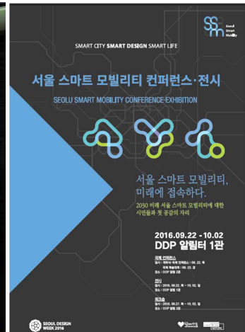
<포스터 디자인 예시>