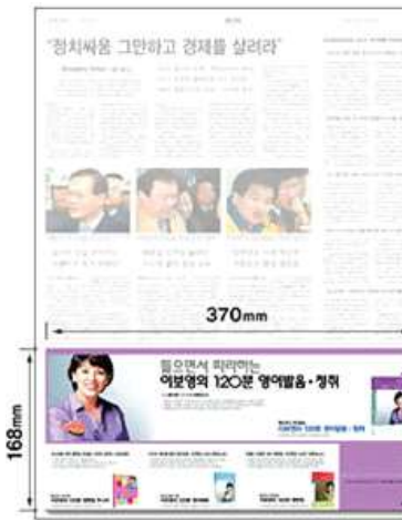
<헤럴드 지면5단광고 예시>